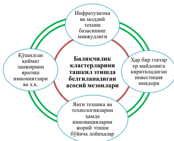
2-rasm. Baliqchilik klasterlarini tashkil etishdagi asosiy mezonlar

nazarda tutgan holda eng asosiy elgilangan vazifalarni bajarilishiga va muammolarning kelib chiqish sabablarini aniqlash imkoniyati yaratiladi.